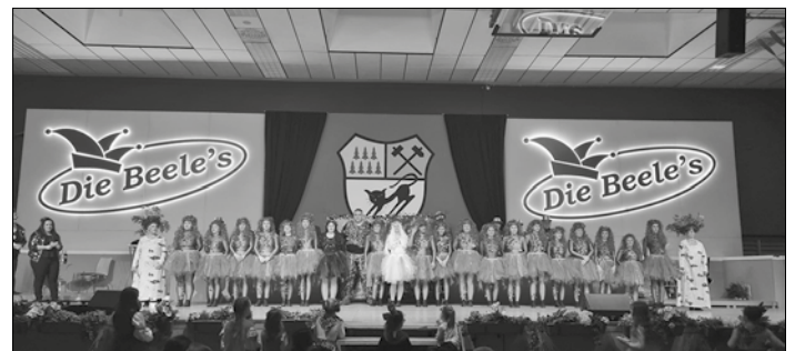
Aktivengarde mit ihrem Showtanz "Baum des Lichts"

Prämiert wurden ebenfalls die Gruppen mit dem schönsten Kostüm, der besten Stimmung sowie den meisten Teilnehmern. Da fiel die Auswahl sehr schwer da sich alle einfach viel Mühe mit den Kostümen gemacht haben und Stimmung war sowieso im ganzen Saal.