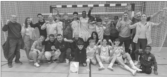
Mit großer Unterstützung verdient den Titel gewonnen: Die C-Jugend der SG SV Gersweiler