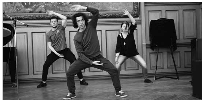
Die Taiji-Qigong-Gruppe der VHS Völklingen

Ruhiger und konzentrierter wurde es während des Beitrags der Taiji-Qigong-Gruppe der VHS. Ihre Performance gab einen Einblick in die leicht erlernbaren Übungen des Taiji-Qigong, die alle Körperbereiche und Gelenke aktivieren.