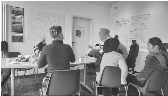
Die Teilnehmerinnen des Workshop