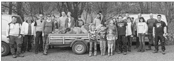
Über 30 freiwillige Helferinnen und Helfer schwärmten im Dorf aus

Am vergangenen Samstagvormittag engagierten sich mehr als 30 Lauterbacherinnen und Lauterbacher bei der saarlandweiten Picobello-Aktion, um ihr Dorf und die umliegenden Gebiete von achtlos entsorgtem Müll zu befreien. Unterstützt vom Saarforst Landesbetrieb sammelten die Freiwilligen entlang mehrerer Straßen und Plätzen zahlreiche Abfälle.