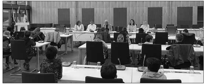
Die Kinder der GGTS Heidstock/Luisenthal waren gut auf den Besuch im Rathaus vorbereitet.

Nach der Fragerunde folgte noch ein Rundgang durch das Rathausgebäude. Sie besichtigten unter anderem das Bürgerbüro, begrüßten Bürgermeister Christof Sellen und machten sich ein Bild von der städtischen IT sowie der Poststelle. Mit vielen neuen Eindrücken fuhren die Kinder im Anschluss wieder in die Schule zurück. Der Oberbürgermeister freute sich über den frischen Wind im Neuen Rathaus. „Mir hat es Spaß gemacht und ich glaube den Kindern auch. Ich könnte mir vorstellen, dass solche Besuche zukünftig öfter stattfinden. Im besten Fall kommt das eine oder andere Kind in einigen Jahren für eine Ausbildung in der Verwaltung zurück ins Rathaus.“