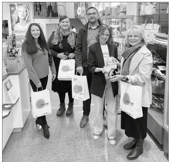
Partner des Gewinnspiels: die CB Parfümerie

Ein ebenso großer Dank gebührt unseren Projektpartnern, die uns mit großzügigen Preisen unterstützt haben: Modemarkt Röther Völklingen, Globus Warenhaus Völklingen und CB Parfümerie Völklingen.