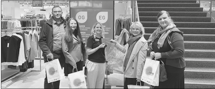
Heimatshoppen zu Gast im Modepark Röther