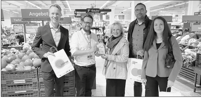
Auch die Globus-Filiale beteiligt sich am Gewinnspiel