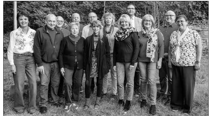
Der neue KulturGut-Vorstand mit den Beiratsmitgliedern (es fehlen: Bertram Sauder, Michael Samsel, Stephanie Meiser, Traudel Bennoit)

Zum Abschluss der Sitzung wurde auf die nächsten Veranstaltungen und Projekte hingewiesen - unter anderem die Vorstellung der neuen Broschüre Kunstwerke im öffentlichen Raum, Völklingen, Teil II, und die nächsten Ausstellungen Sichtweisen I/24 und II/2024 in den kommenden Wochen in den Räumlichkeiten des City-Managements.