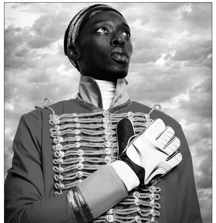
Omar Victor Diop, Pedro Camejo , 2015