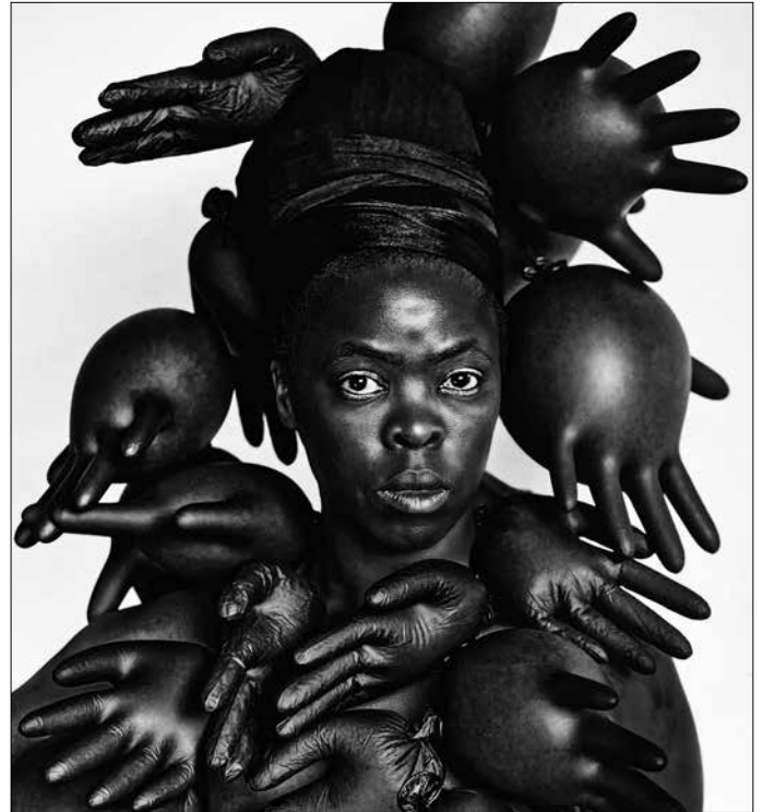
Zanele Muholi, Phila I, Parktown , 2016

In Kooperation mit dem Käte Hamburger Kolleg für kulturelle Praktiken der Reparatur (CURE) der Universität des Saarlandes.